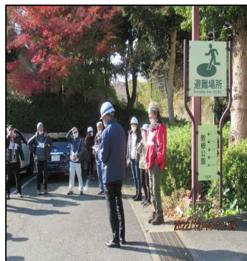
(指定避難場所に到着 講評)