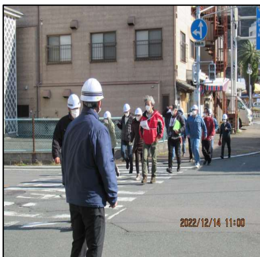
(指定経路で指定避難場所へ向かう)

山麓施設内の利用者および従業員を対象に、従業員が先導して一団で指定避難場所まで徒歩避難を行い、避難ルート中の危険箇所などを確認しました。