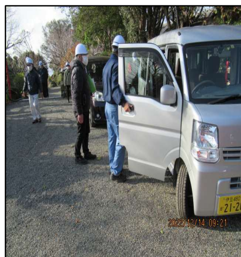
(車寄せから自動車で下山)