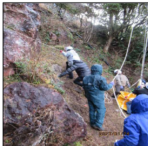
(救出したお客様を安全な場所に誘導)