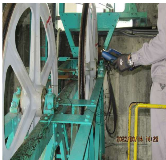
(山麓緊張所内計測中)