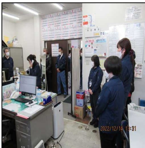
(下田消防署へ通報訓練)

マニュアルに基づき消防署(119番)への通報訓練を行うとともに、消火器の取り扱い方法および設置場所の確認をおこないました。