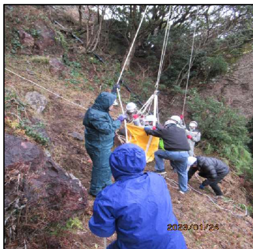
(応急下降器により搬器から救出)

搬器から地上に垂下させたロープを伝って搬器に急行した救助員は、応急下降器によりお客さまを地上へ救出、安全な場所まで誘導する対応を確認しました。