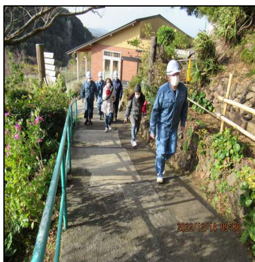
(山頂車寄せまで避難誘導)

山頂施設(テナント含む)の従業員を対象に、お客さまを下山用道路近傍の車寄せまで避難誘導し、自動車にて山麓まで移動する対応を確認しました。