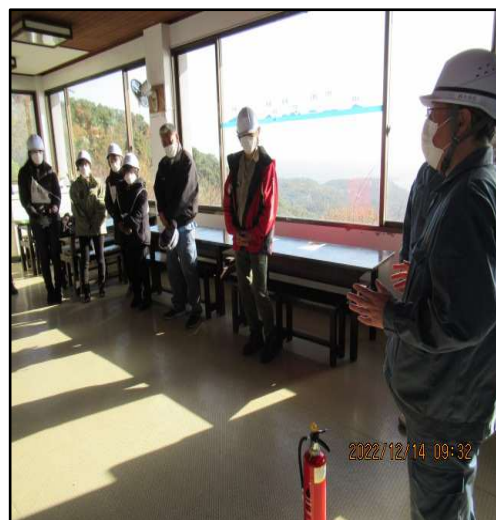
(消火器取り扱い方法の説明)