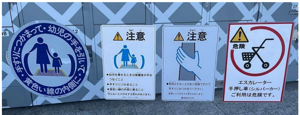
【お客様へのお願い事例(エスカレーターご利用時)】