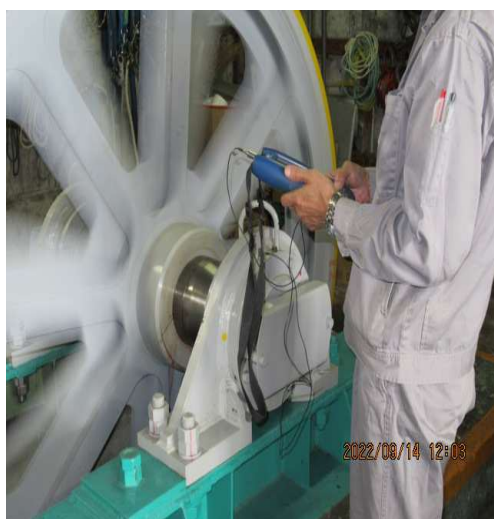
(山頂機械室内計測中)

索道施設の滑車の軸受に伝わる振動を計測し、検査データを蓄積することで設備異常等の客観的な判断の指標としております。検査結果は、異状ありませんでした。